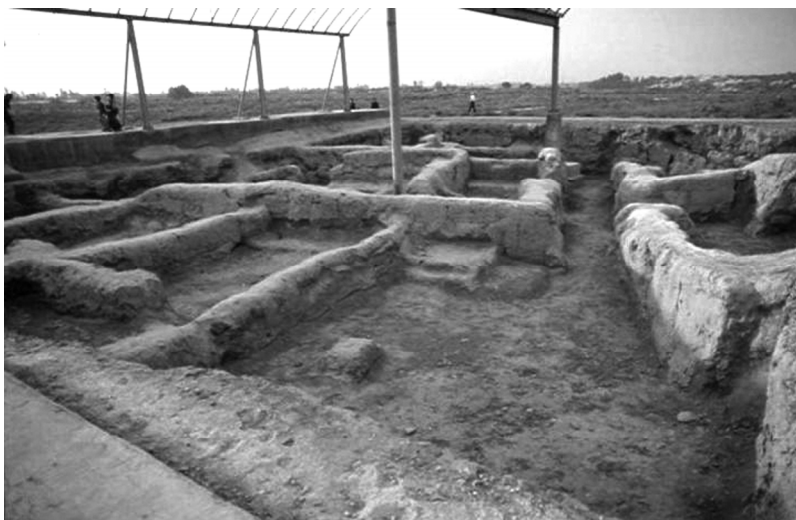
圖 10 西元 7 至 8 世紀 Kuwa 佛寺遺址，烏茲別克東部