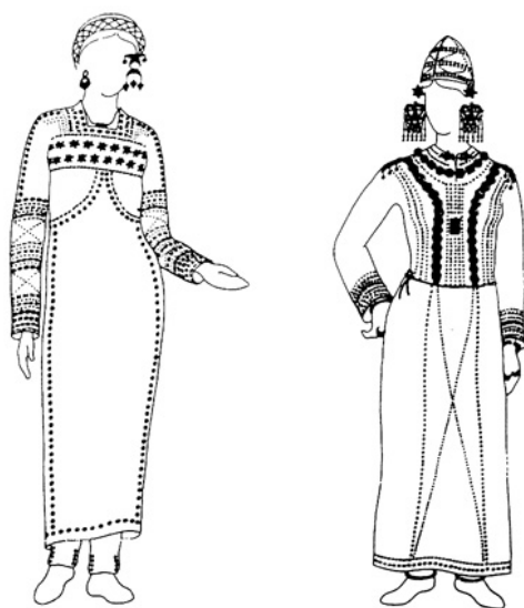
圖 3 北阿富汗席巴爾甘城「黃金之丘」墓主服飾復原圖