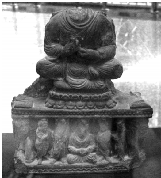
圖 7 西元 1 到 2 世紀，佛坐像，出土於土庫曼尼木鹿， 現存土庫曼尼國家博物館