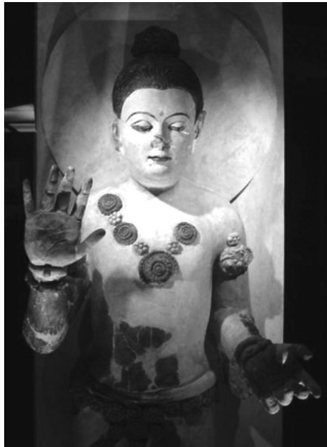
圖 5 貴霜王朝菩薩像，烏茲別克特美茲（Termez）附近 卡拉遺址（Kara-Tepe）出土