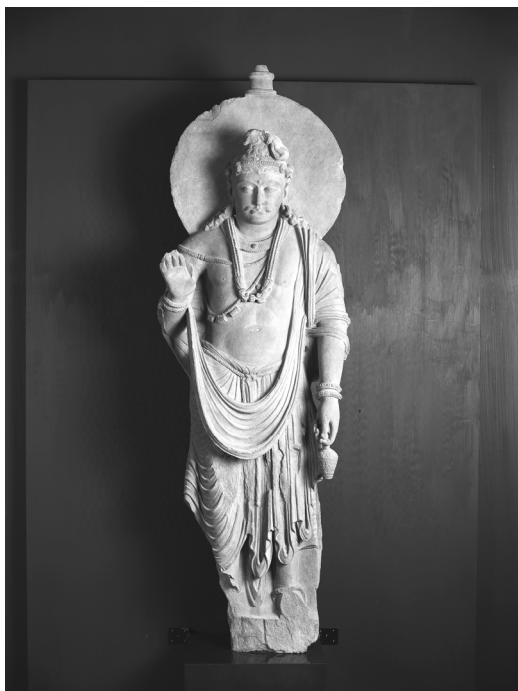
圖 4 西元 3 世紀，犍陀羅石雕彌勒菩薩立像，臺北國立故宮博物院藏