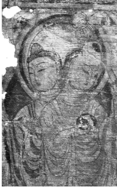
圖 8 高昌發現有雙頭佛造像之絹畫（圖片取自：張文玲，〈古代絲路藝術探微〉，《故宮甲種叢刊》40，民國 87 年，臺北國立故宮博物院）