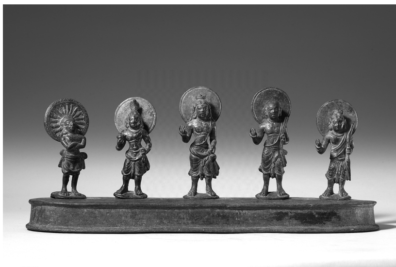
圖 11 西元 5 至 6 世紀，古代犍陀羅地區的青銅人物群像， 臺北國立故宮博物院藏