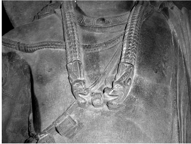
圖 4-1 同上圖，犍陀羅石雕彌勒菩薩項鍊特寫