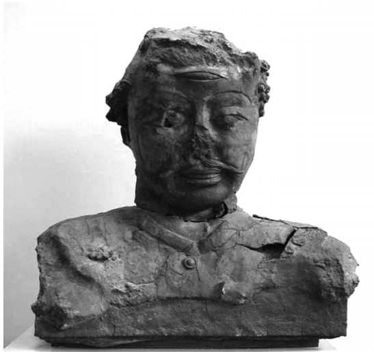
圖 9 西元 7 至 8 世紀 Kuwa 佛寺出土，額頭上有第三眼的半身像，現存烏茲別克塔什干藝術博物館