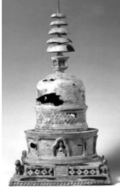
圖 1 犍陀羅青銅佛塔，臺北國立故宮博物院藏