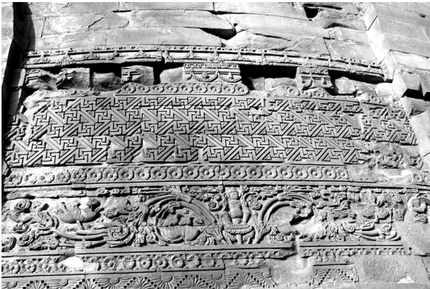
圖 2 印度鹿野 Dhâmekh 佛塔之浮雕紋飾