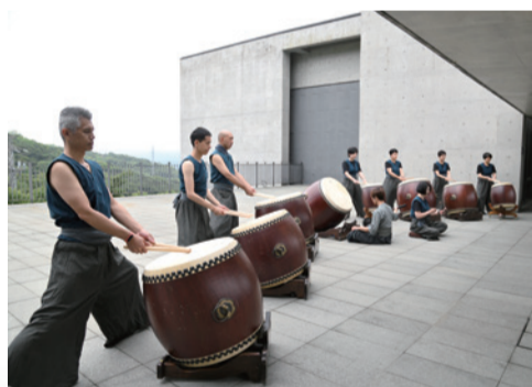
▲ 魄鼓社迎賓表演「心行」。

方丈和尚接著在現場帶領大家念彌陀聖號迴向給近日太魯閣事故的傷亡者，並分享今年法鼓山的祝福語是平安自在，在經過事故後我們才能體會平安的難得，如創辦人聖嚴法師曾說，發生災難是住在臺灣的大家共同感招的共業，雖然現在大家都在追究責任，但其實我們每一個人都有責任，所以我們要反省，也要更珍惜生命的可貴。另外，方丈和尚也以聖嚴法師在大學院教育提到的兩個理念「實用為先，利他為上」勉勵大家，希望大家在不斷學習中成長，並利用