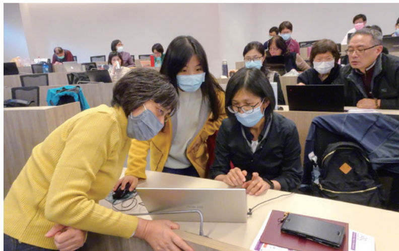
▲研究生間相互交流學習。

曾有人問巴沃導演為什麼一個不丹人要做這個計畫？導演說他希望帶給佛教徒對佛教嶄新的認識並學著珍惜，因為我們差點就會失去佛教，而在述說玄奘的故事時，希望大家看到每個人內心的玄奘，並且學習玄奘的精神——勇氣、虔誠及永不放棄。