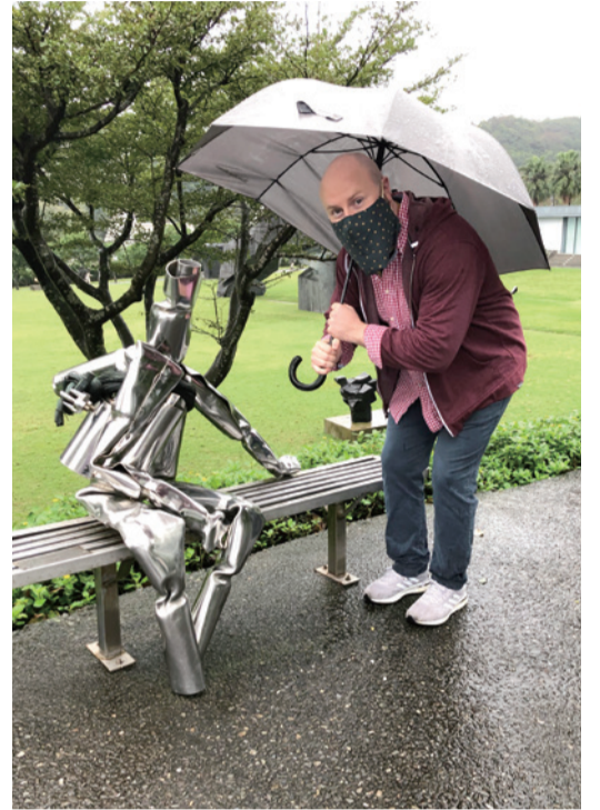
▲ The author enjoying Ju Ming Sculpture Museum.