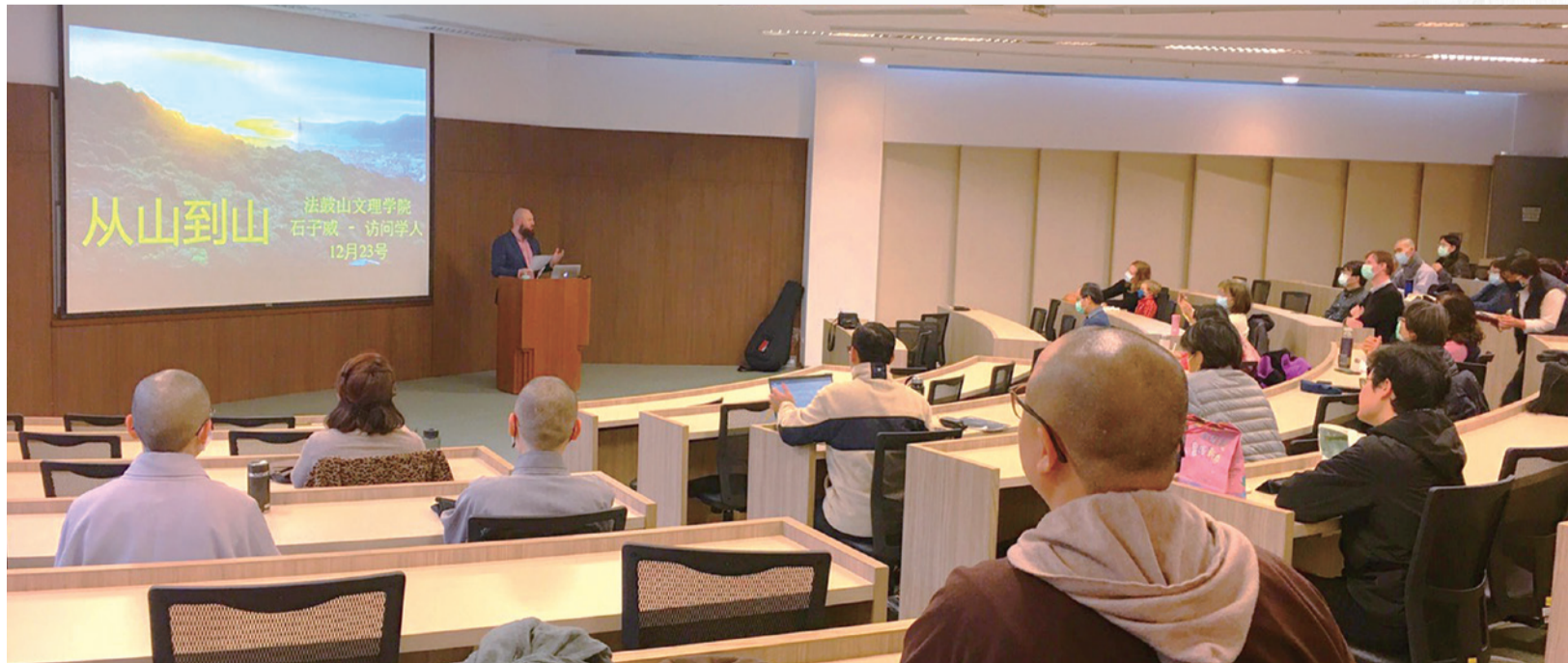
▲ The author presenting a lecture on his experience as a DILA Visiting Scholar.