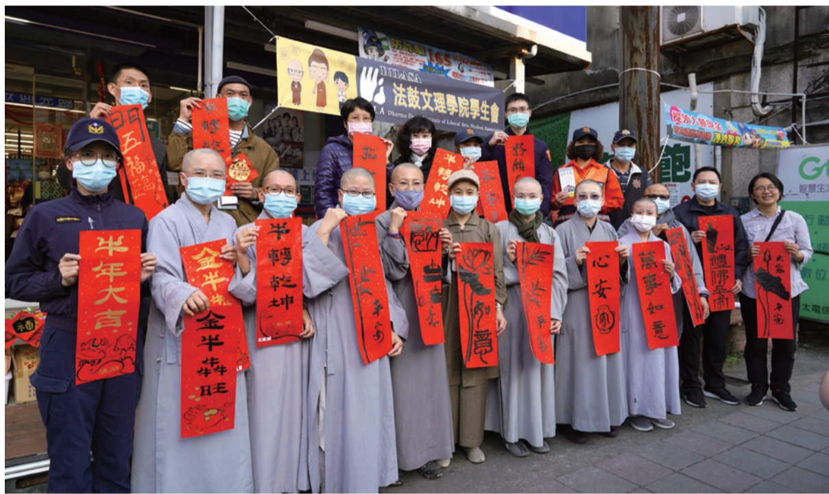
▲本校學生會、書畫社與新北市警察局金山分局共同舉辦2021年「拿春聯·過好年·感恩回饋」揮毫活動。

此外，也是法鼓文理學院學生與金山社區居民的善緣和合，例如：有寫春聯的法師被斜陽照耀，居民則貼心撐起陽傘遮陽；有居民則提供家門口的車位，方便同學停車；也有鄉民提供茶水點心，點點滴滴都是友好互動、善循環。鄉民們看到出家法師寫的字，就非常歡喜，所寫的春聯都富含意義。藉著這些善緣和合，牛年必能牛轉乾坤，參與者都非常喜悅。希望能夠將這個活動繼續辦下去，讓本校與金山社區有更多的互動與共享，廣結善緣。